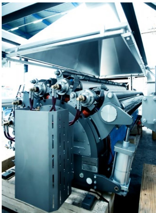
Secador de tambor único ANDRITZ-Gouda