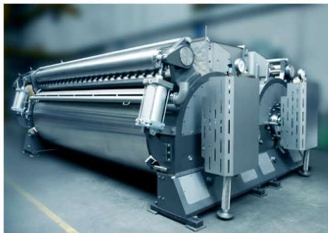
Secador de tambor duplo ANDRITZ-Gouda

Com base na fórmula, uma combinação de ingredientes na composição necessária é pesada em um silo de pesagem e os ingredientes são alimentados em um misturador turbo.