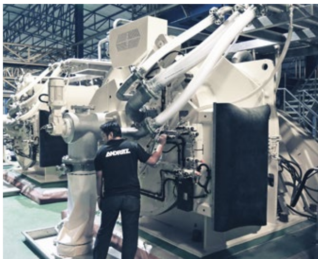
Centrífuga tipo Peeler Krauss-Maffei HZ para aplicação de amido

As centrífugas tipo Peeler Krauss-Maffei HZ são centrífugas de filtragem operadas por lote, conhecidas pelo seu desempenho confiável em altas capacidades. Projetadas e fabricadas para atender aos mais altos padrões de qualidade, são referência no mercado. Servindo a indústria de amido com sucesso desde 1949, com mais de 350 unidades vendidas, conhecemos as exigências do processo da produção de amido. É por isso que estamos constantemente inovando nossas máquinas para enfrentar os desafios de produção. As décadas de experiência e constante inovação deram origem a designs duráveis, parâmetros de desempenho confiáveis, uma ampla variedade de tamanhos disponíveis e recursos opcionais para atender suas necessidades específicas.