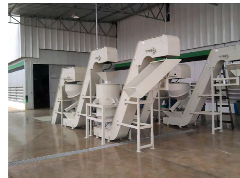
▲ Linha contínua de trituração e limpeza de cavacos

Fabricamos misturadores, sistemas de manuseio de matérias primas, transportadores e muito mais.