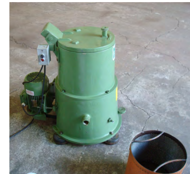
▲ Centrifuga manual para pequenas quantidades (até 500 kg/h) ▲

Nossos sistemas de recuperação de óleos de corte e limpeza de cavacos de usinagem solucionam os problemas de uma área sensível de nossos clientes que é o controle de resíduos. Em indústrias metalúrgicas, aproximadamente 30% do óleo de corte usado é arrastado pelos cavacos causando um problema ambiental ao mesmo tempo um desperdício. Para óleos integrais um sistema desses paga-se em dias e em termos de cavacos de não ferrosos, o retorno pela valorização do cavaco limpo, é muito rápido. Imagine, eliminar um problema e ainda auferir lucros, o que mais podemos querer?