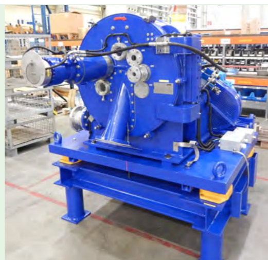
▲ Centrifuga peeler para químicos ▲

Nunca se falou tanto em produtividade, em diminuição dos custos de produção e em competitividade sem obviamente se deixar de lado a qualidade. Aliado a todos estes conceitos, não podemos esquecer de um outro não menos importante que é o da sustentabilidade.