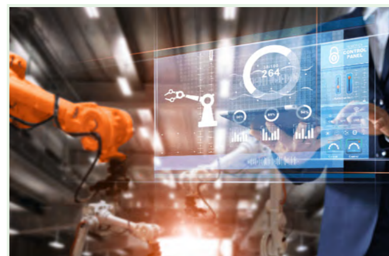
▲ Processos sempre voltados à Indústria 4.0