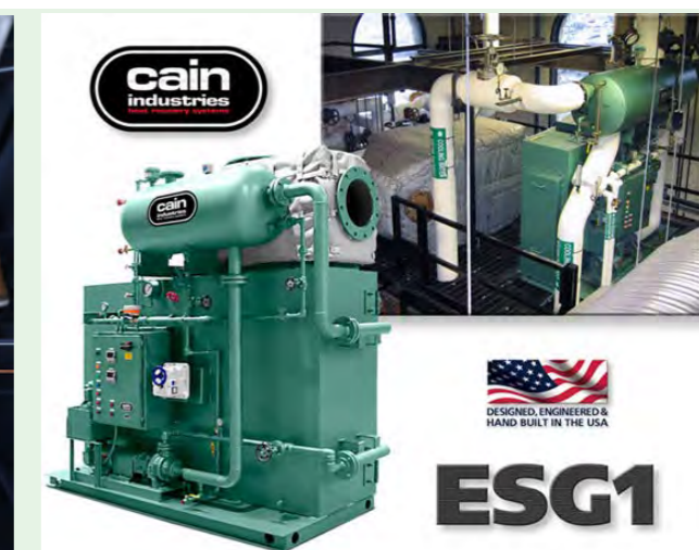
▲ Sistema de recuperação de calor ▲

Os processos produtivos da ARCORI se baseiam na Indústria 4.0, para isso contamos com parceiros de fabricação rigorosamente escolhidos de forma que o projeto das máquinas, equipamentos e sistemas que saem de nossos modernos softwares de CAE/CAD e CAM sejam seguidos à risca com rigor dimensional e qualidade.