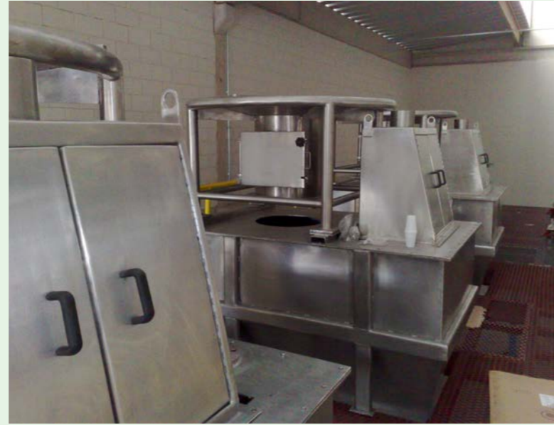
▲ Estação de manuseio de matérias primas sólidas