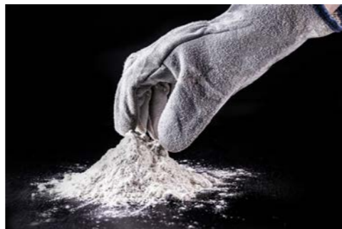
A escolha do método de manuseio faz a diferença em sistemas de produção.

Desde uma moega com rosca até uma válvula rotativa para alimentar um sistema de transporte pneumático, levando as matérias primas a um silo balança, são acessórios que possuímos nos nossos sistemas de manuseio de matérias primas.