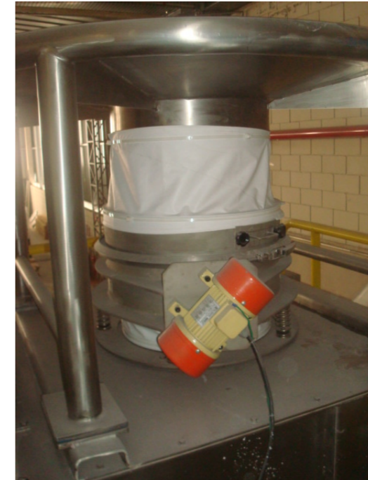
▲ Materiais difíceis de fluir necessitam de acessórios específicos. Aqui um vibrador.

Equipamentos e sistemas de manuseio de matérias primas sólidas, macro e micro ingredientes, dosagem por perda de peso ou totalização por ganho de peso, silos balança, transportadores para transferência eficiente e limpa até a inserção das matérias primas no processo de uma forma precisa, limpa e confiável.